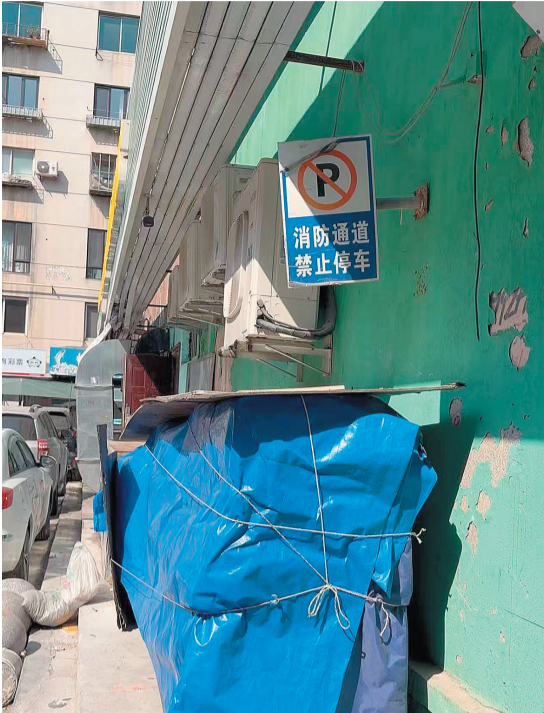
“消防通道,禁止停车”牌匾下,堆满杂物,道路停满车辆。

中山区政协委员王昌青认为,违规者多抱有侥幸心理,根源在于安全意识淡薄。他呼吁加大法规普及与案例警示教育,通过社区、以短视频、公益广告等宣传渠道形成“人人守护生命通道”的社会共识。