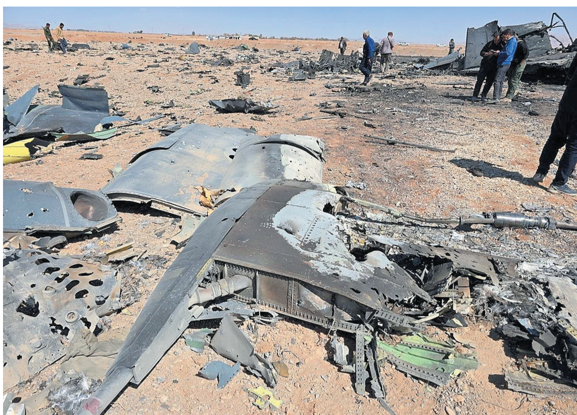
这张4月5日发布的社交媒体图片显示，伊朗伊斯法罕一处地点散落有疑似美军飞机残骸。

新华社德黑兰4月6日电 据伊朗法尔斯通讯社6日报道，伊朗外交部发言人巴加埃当天表示，不排除美军在伊朗中部伊斯法罕省的行动是为了窃取浓缩铀。巴加埃说，上述行动对美国来说是“灾难性的失败”，希望美方从中吸取教训，“无论何时伊朗领土遭到攻击，整个伊朗都会做出回应”。