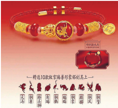
故宫上新瑞兽系列手绳