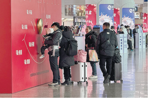
“敲”好运，“敲”幸福。

小年当日，机场航站楼化身“年味剧场”：“下一站·回家”主题管乐快闪奏响新春乐章，“大连印象”民俗体验活动区前人山人海，旅客在“非遗匠心”展区领取贴葫芦、灶糖等新春伴手礼。错