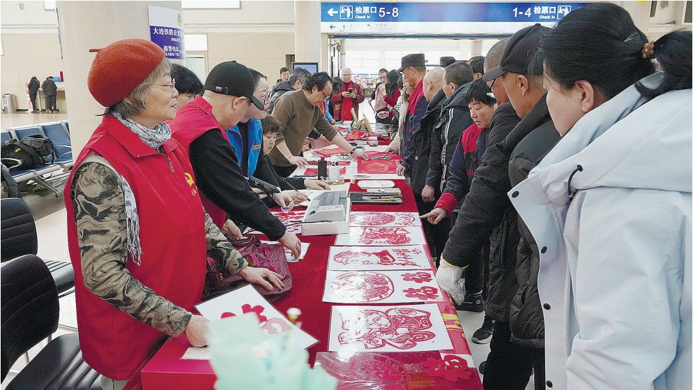
十几位书画家和剪纸艺术家现场创作，为旅客送上对联、福字、窗花和画扇。

本报讯(大连新闻传媒集团/大连云记者金博源)2月10日，北方小年。大连站、大连北站候车大厅内洋溢着节日的喜气，车站联合市慈善总会、大连市金黑石书画院，共同举办“万福迎春”书法公益活动，邀请了几十位书画家和剪纸艺术家现场创作，为旅客们送上对联、福字、窗花和画扇，让南来北往的旅客提前感受到了浓浓的年味儿。