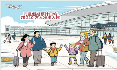
朱慧卿作

国家移民管理局提示广大中外出入境旅客,出行前及时关注口岸客流变化和通关情况,仔细检查出入境证件及签证签注是否有效;中国公民出境需提前了解前往地安全形势、入境政策,合理安排行程,强化风险防范意识,注意人身和财产安全。通关过程中如遇困难,可随时拨打国家移民管理机构12367服务热线或向现场执勤的移民管理警察寻求帮助。来源:新华社