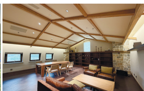
葡萄酒工坊内设会员区品酒室。