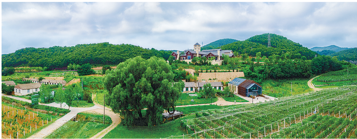
弥漫着清甜气息的金石葡萄酒庄。